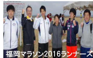
福岡マラソン2016ランナース