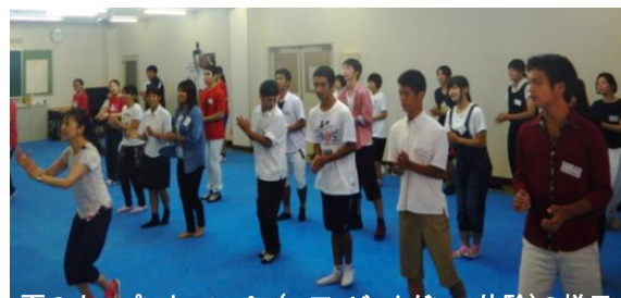
夏のオープンキャンパス(エアロビクダンス体験)の様子

3月12日(日)にオープンキャンパスを開催いたします。さまざまな体験を準備し、みなさまのご来場をお待ちしております!