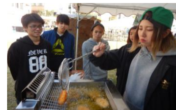
揚げたてコロッケ