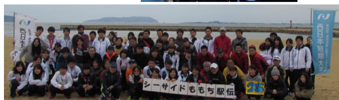
シーサイドももち駅伝 2016