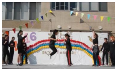
1年生のダブルダッチパフォーマンス