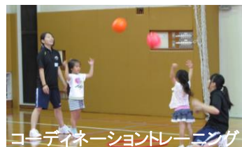
コーディネーショントレーニング

楽動塾(がくどうじゅく)は“運動神経を高めよう!”をテーマに様々なスポーツで体を『楽』しく『動』かし、できないことができるようになる喜びを感じてもらうことを目的に昨年より始めた運動塾です。今年度は10月1日(土)、15日(土)、29日(土)に開催し、全日程とも大盛況でした。参加して下さったみなさんの楽しむ姿や笑顔を見ることができ、私たちもたくさんのパワーをもらいました。